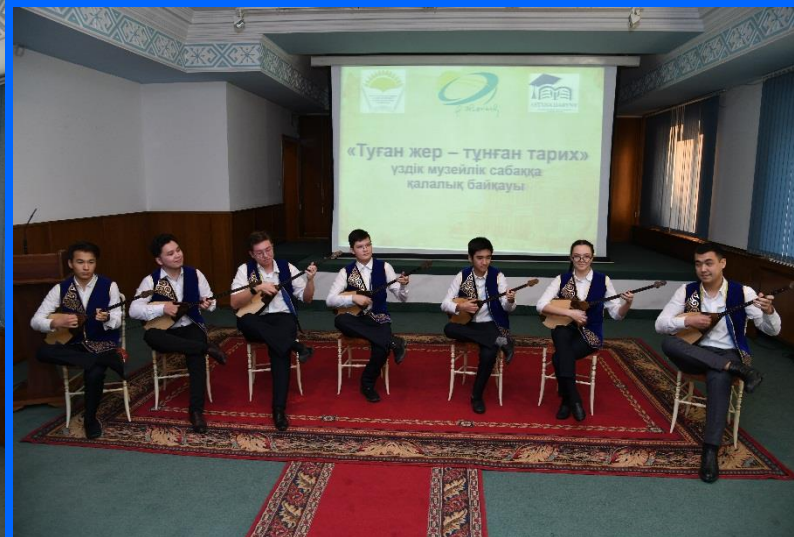
«Туған жер – тунған тарих» үздік музейлік сабаққа қалалық конкурсы