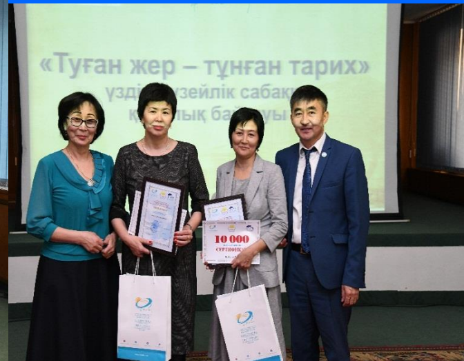
«Туған жер – тұнған тарих» үздік музейлік сабаққа қалалық конкурсының жеңімпаздары