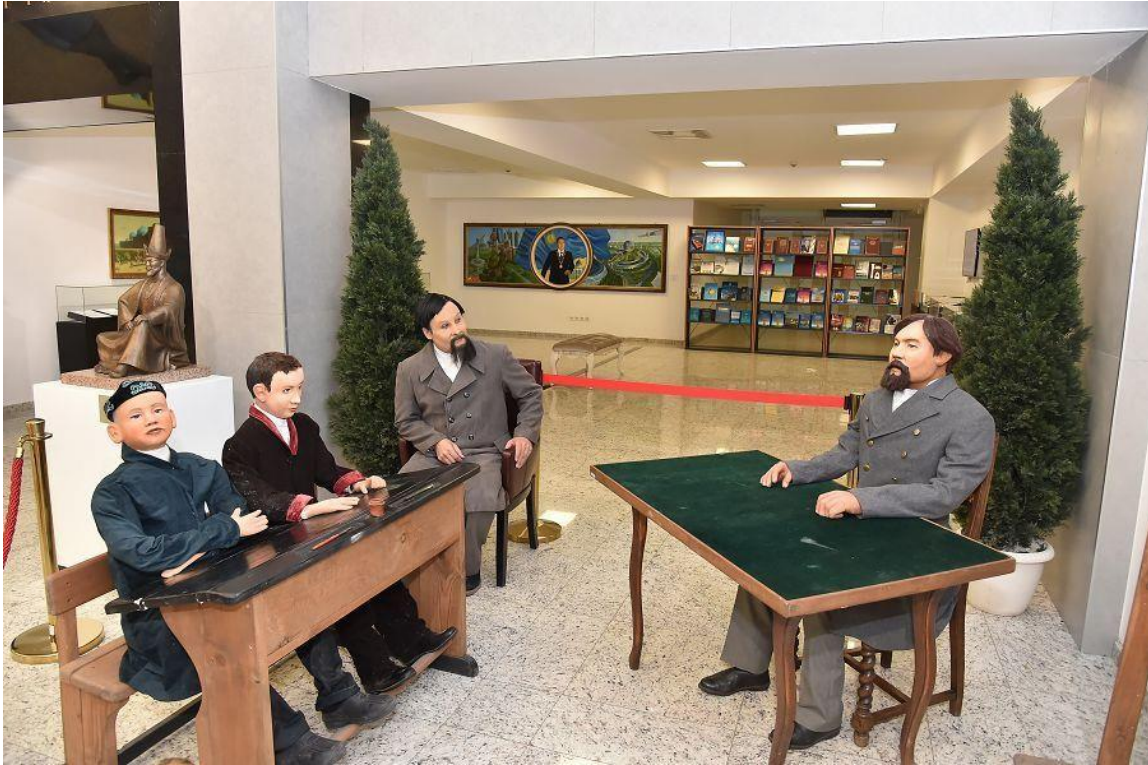
«Даланың дара ұстазы» атты көшпелі көрмесі