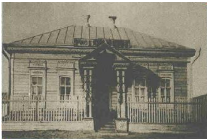
Торғайда ашқан ең алғашқы мектеп