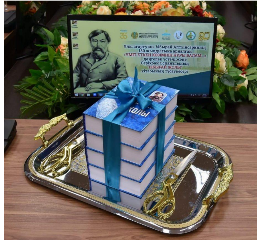
«Ібырай жолы» кітабының тұсаукесер рәсімі