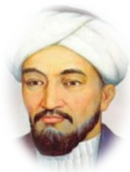
Әбу Насыр Әл-Фараби

« Жүрек - басты мүше, мұны тәннің ешқандай басқа мүшесі билемейді. Бұдан кейін ми келеді. Бұл да басты мүше, бірақ мұның үстемдігі бірінші емес»