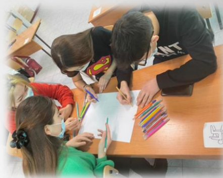
Совместная работа студентов