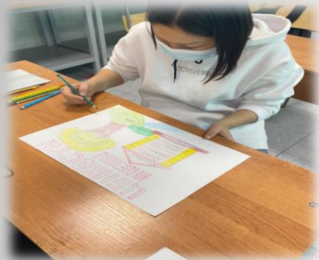
Я рисую свой мир